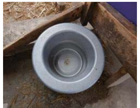
写真5 こまめに掃除した水槽