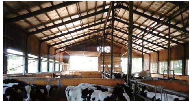
写真2 窓・扉を全開にして換気を行う牛舎