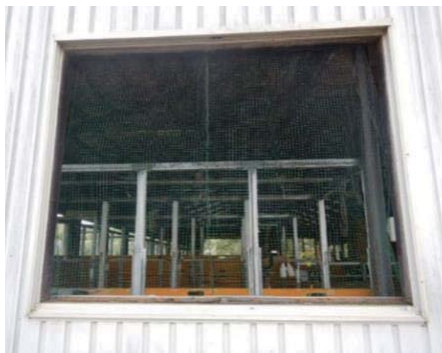
写真3 窓枠を外して換気