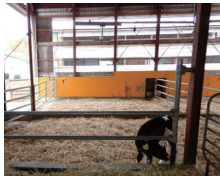
写真4 きれいな牛床管理