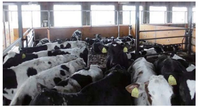
写真1 過密により牛体が汚れる事例

注：「1頭あたりの面積」には採食通路を含まない。 (MWPS第7版フリーストール牛舎ハンドブック)