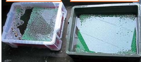
水洗い用の踏み込み槽