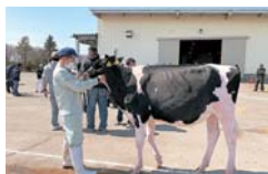
リードマン講習の様子

生徒からは、「牛が可愛かった。牛を引っ張るのは、細かい技術が必要だということが分かった。」や「牛の審査は難しかったけど、考える時間が楽しかった。」という感想を聞くことができました。