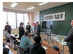
酪農機械・施設学の様子

この講義は、酪農情勢や管理全般に関する知識・技術を習得するために企業から専門家をお招きして、5月10日(水)に実施しました。