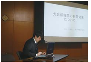
修了研究活動発表会の様子

11月27日(月)に専攻科ゼミ室を会場にして「修了研究活動発表会」が行われました。これは、2年目学生が1年間自家の課題解決のため、研究に取り組んだ成果を発表するものです。今年度は、「光合成細菌の制菌効果について」「分娩後のCa摂取量向上と周産期病の低減」「初乳が及ぼす影響～栄養価と疾病率」「乳房炎菌の同定による牛舎環境の改善～体細胞数の減少に向けて～」「我が家の労働環境と将来の経営について」と題して5つの発表がありました。それぞれ、育成牛舎内での臭気測定実験の結果の考察、周産期病予防と生産性の向上を目指しての取り組み、F1子牛への適切な初乳給与が成長に与える影響、自家の牛床の調査・分析、近い将来経営移譲された時の労働環境について牛舎新築も視野に入れてのシミュレーションの結果を発表しました。関係機関から足を運んでいただいた8名の先生方より「この研究を今後の経営に生かして欲しい」、「着眼点良かった」、「今後もサポートしていく」との助言、講評をいただきました。お忙しい中お集まり下さった関係機関の方々にご場をお借りして深くお礼申し上げます。