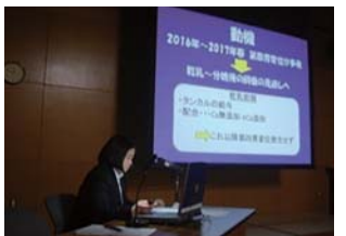
修了研究活動発表会の様子