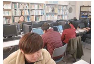
修了研究活動まとめの様子