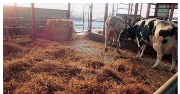
写真2 牛床マットと敷料を敷いた乾乳牛舎（分娩房）