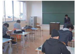
酪農経営管理学の様子

11月は学生が参加する研修会もなく、家業の方も一段落ということで、落ち着いて平常の授業に取り組んでいます。後期の授業は、酪農に精通した4名の先生方が講師を務め、繁殖の基礎から応用までを学ぶ「乳牛繁殖学」、環境問題と畜産の関係を理解すると共に牛の糞尿を最大限に利用して肥料購入費削減につなげる方法を学ぶ「糞尿利用学」、帳簿簿記について学ぶ「酪農経営管理学」が展開されます。これに加えて2年目学生はいよいよ修了研究のまとめの時期。登校時間前からプレゼンテーションに改良を加えたり、担当教員と最後のデータ確認に取り組む姿が見られました。