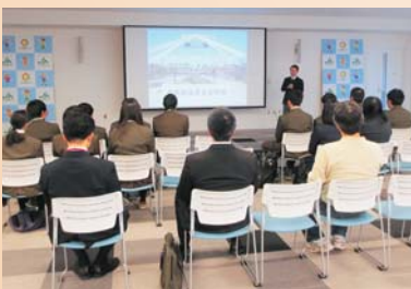
別海高校・中標津高校の生徒13名が参加。関連大学など7団体がプレゼンテーションと個別相談を実施(11月25日 別海本所で)

だけでなく、大変さや、やりがい、厳しい寒さもしっかりと伝えた上、それでも来たいという方を親身にサポートしていくべきだと考えています。また、実際現場で関わる担当者や就農希望者、新規就農者等の声を反映させるなど柔軟性をもって取組んでいきたいです。 間接的な後継者確保・育成に向けた取組みとしては、管内の農業高校生が農業大学・専門学校生の情報を得ることを目的に「農業関係学校進学相談会」を管内JAで連携し、3年前から実施しております。 個人的には、進学先で、