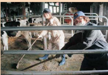
東京農業大学の酪農体験実習受け入れ

①専門的・実践的な農業を学んでほしい、②人生の恩師となる先生との出会いや一生付き合える仲間づくりを励んでほしい、③地元をちょっと離れて客観的にみることで、別海町や根室市の大きな魅力を再発見して頂きたいです。 今後も、各支所組合員の皆さまにご協力を頂きながら、酪農体験実習の受け入れ実施、「新農業人フェア」への出展による担い手の確保等、地域・関係機関が一体となった取組みを継続して参りますのでご理解・ご協力をよろしくお願ひ致します。