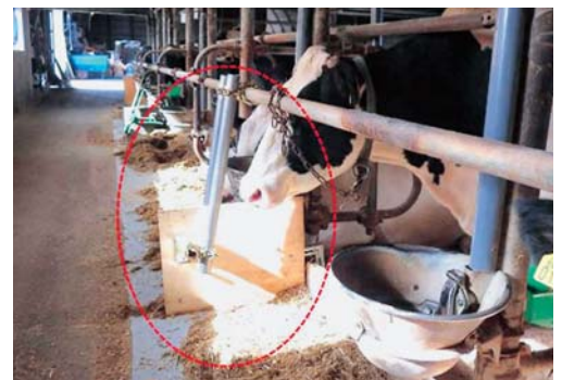
写真1 ニューヨークタイストールに自作の盗食防止板を設置