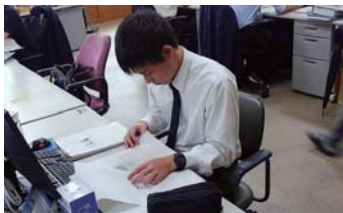
インターンシップの様子 別海町役場

9月10日(火)より酪農経営科2年生が3日間の日程でインターンシップに取り組みました。今年度はJA道東あさひ、別海町役場や愛光幼稚園、コープさっぽろなど8企業に受け入れて頂きました。様々な就労体験実習を通して、進路活動や社会性の向上に活かせる貴重な機会となりました。実習を終えた生徒達は、これから報告会やふりかえり学習を通して、さらに就労や進学への意識を高めていくと同時に、今回の実習を次年度の農家委託実習につなげていきます。