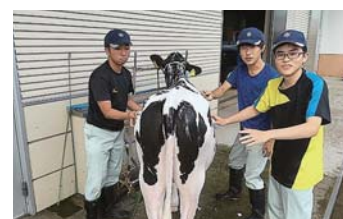
育成牛の飼養管理実習(1年生)

酪農経営科では約2ヶ月ほど前から農業クラブOB会の協力のもと、2頭の育成牛を借用して管理実習をおこなっています。1年生から3年生までが主に畜産の授業や放課後にかけて2頭の育成牛の飼養管理について学んでいます。10月中旬まで管理実習は続く予定で、実践的な知識や技術の習得につながっています。