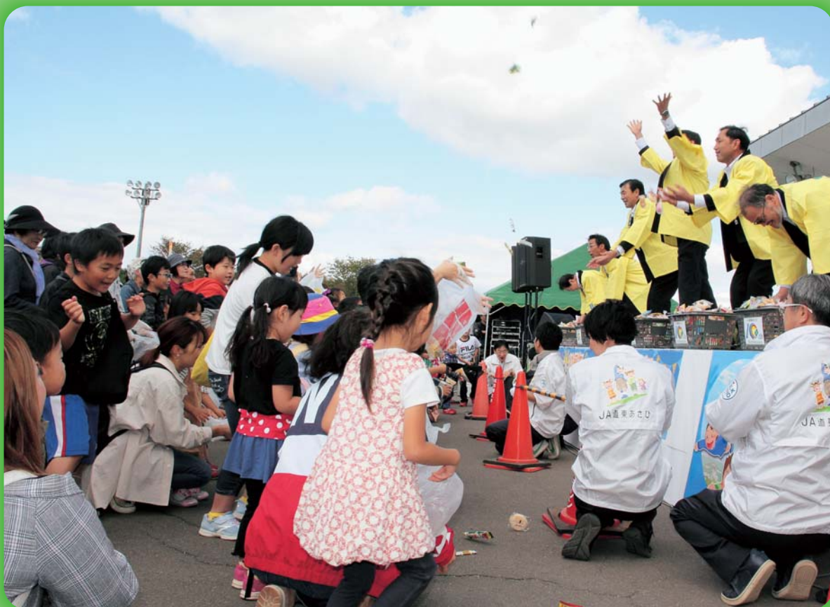
JA道東あさひ10周年イベント