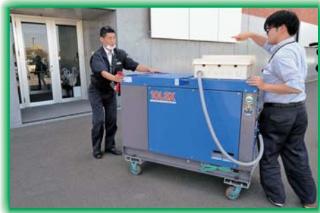
発電機の模擬接続

今回の訓練でわかった課題を整理改善 し、学んだ経験を活かして、担当部署にて 早期に事業継続計画（BCP）策定を進め る予定です。加えて、酪農協議会と連携し 「地域災害訓練」の実施に向けた取り進め を行い、農家、地域、農協、行政等の役 割・連携のあり方を整理し、いざ大規模災 害が発生してしまった場合、少しでも被害 を減らし、復旧復興が早められるよう、取 り組みを進めて参ります。