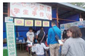
ソーセージ試食の様子

農業特別専攻科では、加工実習で製造した「ソーセージ試食」と乳牛の模型を使用した「搾乳体験」、活動報告として「活動パネル展示」を実施しました。