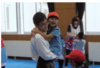
園児とのふれあいの様子

9月12日(木)にくるみ幼稚園の園児を招いての交流会「ふれあい農園」を開催しました。当初予定していた、園児との芋掘りは雨天のため実施できませんでしたが、事前に収穫してあったジャガイモを調理し一緒に味わいました。