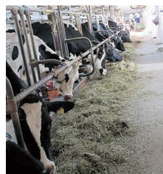
写真2.良質粗飼料を1日4回に分け、十分に給与している農場

搾乳ロボットでの搾乳間隔の短縮や1回の搾乳量の減少により、FFAが増加することがあります。過度な頻回訪問や頻回搾乳となる設定は避けましょう。