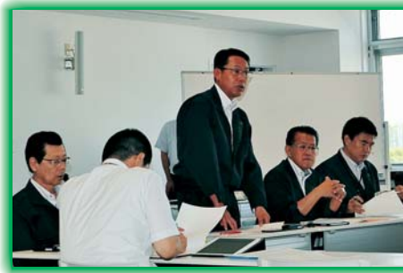
災害対策本部の設置