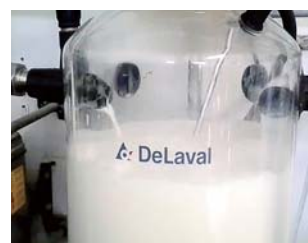
写真1.レシーバジャー内での生乳の泡立ち

バルク乳の過攪拌や凍結、泡立ち（写真1）などは、物理的な衝撃となって脂肪を包む脂肪球膜を破壊します。すると脂肪分解酵素（リパーゼ）の作用を受けやすくなり、脂肪分解が起こるため、ランシッド臭を生じます。