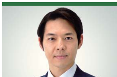
鈴木 直道 北海道知事

北海道胆振東部地震では、組合員による被災組合員への支援、JA役職員や連合会による被災JAへの支援、そして、生協組合員の皆様から多大な義援金を頂くなど、「協同組合の力」を再確認させて頂きました。私たちJAグループ北海道は今後とも、被災された組合員を支援して参ります。