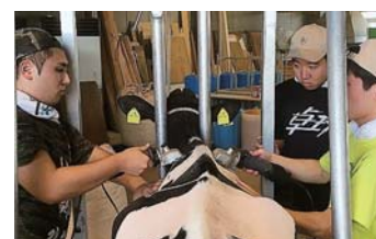
育成牛の毛刈り(3年生)