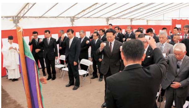
工事の無事を願い牛乳で乾杯