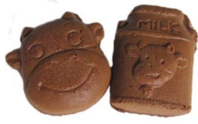
←子供達にも大好評だった「牛型焼き」