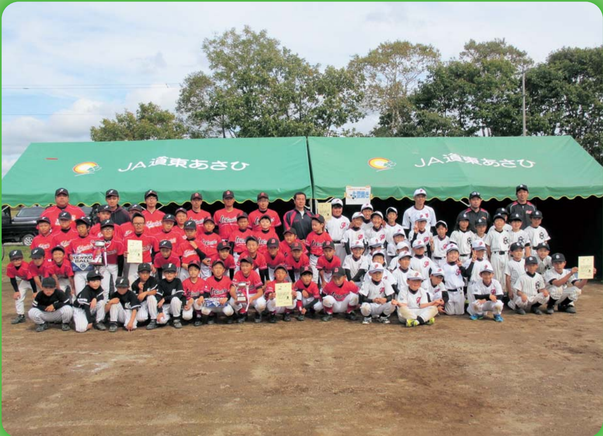
JA道東あさひ酪農協議会杯少年野球大会 参加した4チームの選手たち