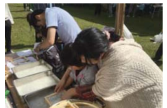
紙すき体験の様子

9月17日(日)別海町産業祭に参加しました。農業特別専攻科では、牛乳パックから葉書を作成する「紙すき体験」と乳牛の模型を使用した搾乳体験を実施致しました。参加した学生は、来場者の方とふれあう事ができ、とても充実した表情でした。また、「紙すき体験」、「搾乳体験」ともおかげをもちまして大盛況のうちに終