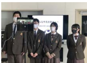
小学生に説明している様子

酪農経営科の1・2年生の4つの研究班の生徒たちが酪農や乳牛、乳製品についてZOOMを使って説明しました。