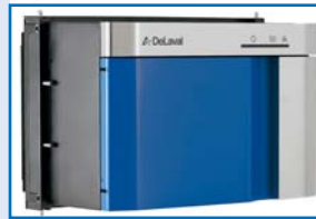
ハードナビゲーターHN100