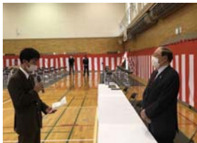
農クOB会入会式の様子

3月1日（火）に令和3年度の卒業式が本校体育館で挙行されました。在校生は教室でオンライン配信によって卒業式に参加しました。