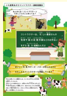
キッズ向け パンフレット