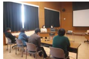
特別教育活動の様子

2月25日（金）に送別激励会を実施しました。修了式を間近に控えた2年目学生に向け、1年目学生が学校生活を振り返るゲームやスライドショーを上映し、思い出話に花を咲かせました。今後酪農を担っていく学生達へのよい思い出になったと思います。