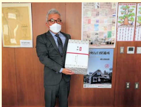
別海町 登藤教育長

当連絡協議会では、今後も飼料生産受託組織として、担い手確保や畜産業の発展に寄与すべく尽力して参ります。