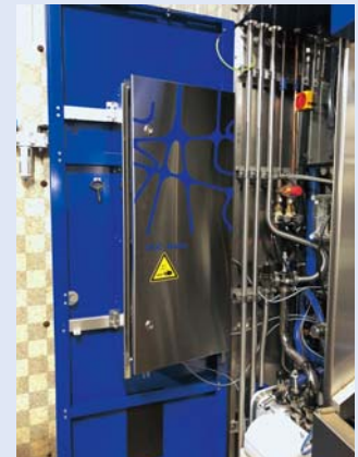
OCCオンラインセルカウンタ