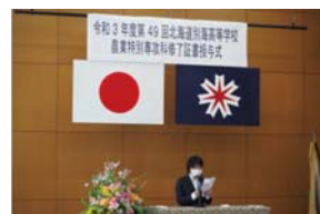
第49回修了証書授与式

浜中町で自家牧場に入り、1名は農業記者として新しい道を目指します。彼らが無事修了を迎えることができたのも地域の皆様、関係機関のご理解とご協力あってのことです。この場をお借りして感謝申し上げます。