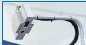
BSCボディコンディショニングスコアリングシステム