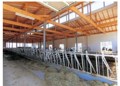
写真 施設やパドックへの馴致を考慮した育成舎（株式会社mosir 別海町中西別）

連動スタンションに馴致するには、施設内の子牛が頭を入れやすそうな隙間を塞ぐことと、連動スタンションから頭を抜く方法を覚えさせることが重要です。