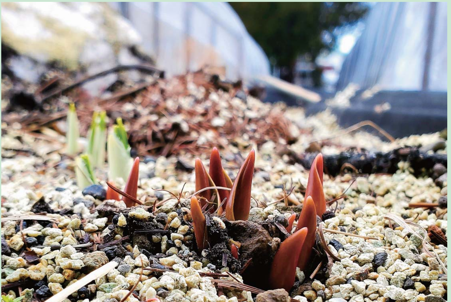
クロコリの芽吹き