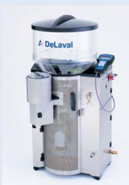
カーフフィーダー CF1000S

搾乳ロボットシステム導入の効果を高めるポイントの1つに、牛舎内の作業をできるだけ自動化することが挙げられます。例えば、通路の除糞を行うスクレーパーやエサ寄せロボット（バトラーゴールドPRO）は必須機器として推奨しています。これ以外にも、給餌ワゴンや定置型ミキサー、フィードステーションといった自動給餌システム、自走式給餌ロボット（シャトルECO）や、敷料散布装置（フライピット）も作業の自動化を進める機器としてご紹介しています。搾乳ロボット牛舎だけでなく哺育に関しても、弊社のカーフフィーダー（哺育ロボット）はデルプロシステムへの接続が可能となっており、搾乳ロボット牛群と同じ管理ソフトウェアで仔牛の給餌管理が可能となっています。