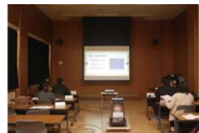
基礎研究活動発表会