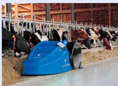
バトラーゴールドPRO