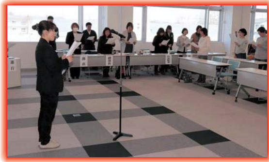
J A女性組織綱領の朗唱