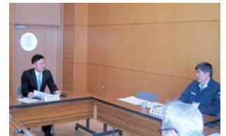
経営面接指導の様子

2月22日(金)2年目学生を対象に経営面接指導が実施されました。自家の1年間の酪農経営(組合員勘定取引や資産台帳の変化・追加など)を経営管理ソフトを用いて毎月に入力し、損益計算書、期末貸借対照表と乳検データを元に、総合的な分析を行います。分析データを基に自家経営についてご指導とご助言をいただき、今後の経営に活かすことを目的としています。酪農試験場技術普及室、農業改良普及センターや学生の所属農協より講師をお招きし、今後の経営についてアドバイスをいただきました。学生にとっては、「日々の悩みや将来のビジョンも含めた面接指導となり、「普段なかなか聞くことのできない内容について、たくさんのアドバイスをいただき、今後の経営改善の一助としたい」などの感想がありました。