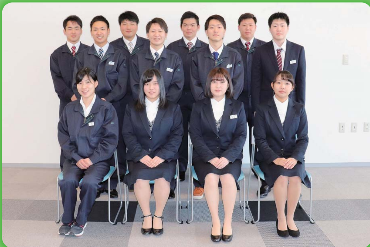
平成31年度新採用職員