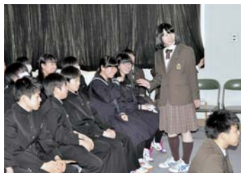
中学生に説明している様子

3月15日(金)に別海中央中学校2年生の「進路学習」にかかわる講師として酪農経営科の1・2年生がプレゼンテーションを行いました。