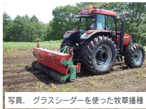
写真. グラスシーダーを使った牧草播種

試験はチモシー (TY)、アルファルファ (AL)、シロクロバ (WC) の3草種混播で、小規模の精密試験 (手播き試験) と実際にグラスシーダーを使って播いた (機械播き試験) の2種類を実施しました。