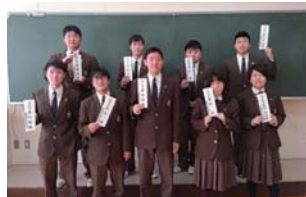
食品衛生責任者となった生徒達