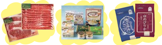
※写真は抽選会の賞品の一例です。

10,000ポイントで応募 ▶ 5,000ポイントで応募 ▶ 2,000ポイントで応募 ▶