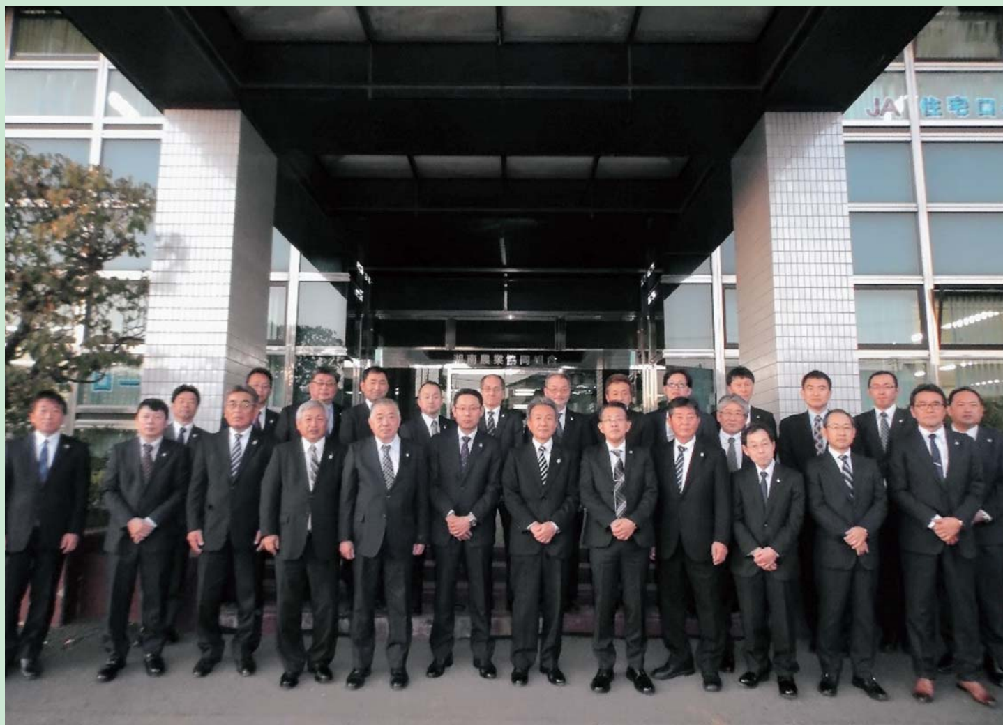
役員道外視察研修